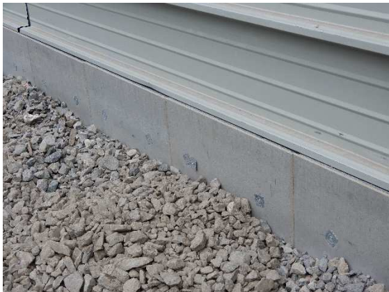
Côté extérieur du mur