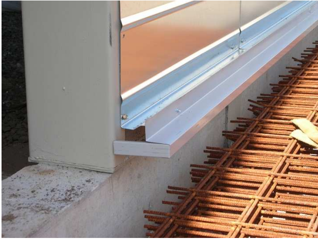
Position dans la hauteur des poteaux

→ Mise en place de la bavette et du reste du bardage