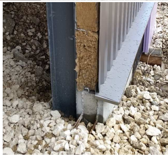
Position à l'extérieur des poteaux