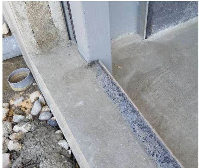
Côté intérieur du mur